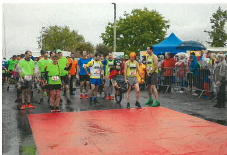
Départ de Ryad

Quelques kilomètres après le départ, la pluie cesse enfin.